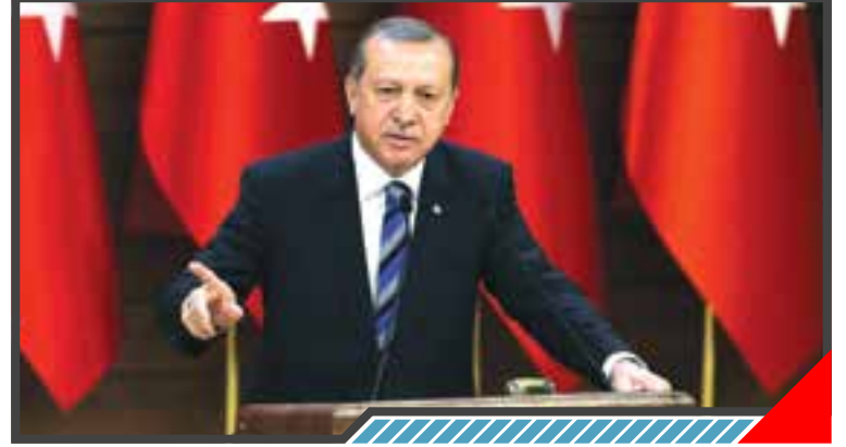
أردوغان: لن نسمح إطلاقاً بإنشاء دولة جديدة تتماهي سوريا