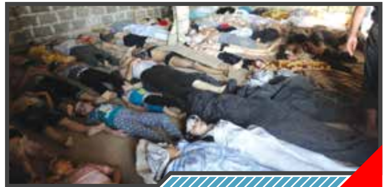
٤ سنوات على مجزرة الكيماوي في الغوطة والمجرم دون عقاب

Suriye muhalefeti, 22.08.2017 tarihinde Yüksek Müzakere Heyeti ve Kahire ve Moskova'dan gözlemcilerin katılımıyla Riyad'daki görüşmelere başladı. Görüşmeler sırasında, siyasi çözüm ve Suriye Devlet Başkanı Beşar Esed'in akıbetinin belirlenmesi meseleleri ele alınacak, ayrıca bu görüşmelerden sonra gerçekleşecek olan Riyad 2 kongresinde, Cenevre müzakerelerine katılacak heyetin teşkili üzerinde durulacak.