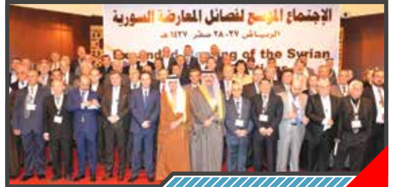
انطلاق اجتماعات المعارضة السورية في الرياض.. بمشاركة منصتي «موسكو» و «القاهرة»

جدد الرئيس التركي رجب طيب أردوغان رفض بلاده القاطع لأي مساعي من شأنها أن تؤدي لإنشاء دولة جديدة في شمالي سوريا، وقال أن «ب ي د»، و«ي ب ج» تسعيان لإقامة ممر إرهابي في شمال سوريا لغاية سواحل البحر الأبيض المتوسط، مؤكداً على أن بلاده ستتخذ كافة الإجراءات بحق تلك التنظيمات الإرهابية. Türkiye Cumhurbaşkanı Recep Tayyip Erdoğan, ülkesinin Suriye'nin kuzeyinde yeni bir devlet kurulmasına yönelik girişimleri kabul etmeyeceğini yineledi. PYD ve YPG'nin Suriye'nin kuzeyinde Akdeniz'e kadar bir terör koridoru oluşturmaya çalıştığını vurgulayan Erdoğan, Türkiye'nin bu terör örgütlerine karşı tüm önlemleri alacağını altını çizdi.