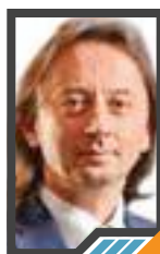
المشكلة الوحيدة في سوريا هي الاحتلال الأمريكي فيها