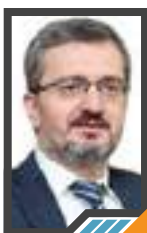
قمة أنقرة التي جاءت في مرحلة ومنعطف حاسمين