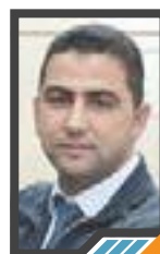
الديمقراطية والربيع العربي