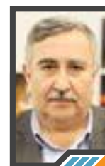
الإرهاب الأسدي أعلى مراحل الإرهاب وأشنع