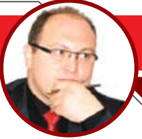
محمد زاهد جول

كاتب ومحلل تركي - رئيس بيت الإعلاميين العرب في تركيا