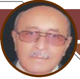
دير الزور تذب