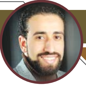
زعما برتبة عملاء