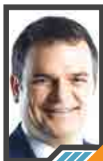
عملية غصن الزيتون دليل للشباب