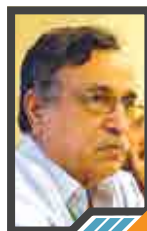
غصن الزيتون والانتصار