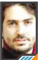
ثباتنا هو الذي يحدد وجهتنا