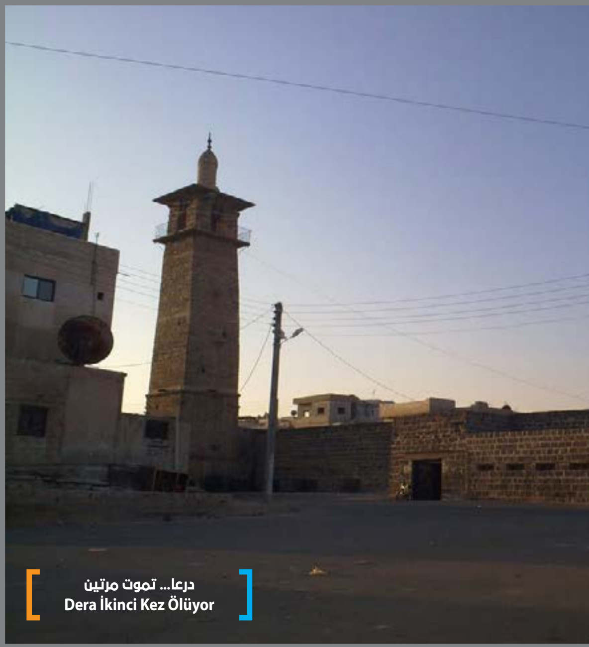
درعا... تموت مرتين Dera İkinci Kez Ölüyor