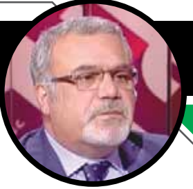
فادي ترامب وقرار