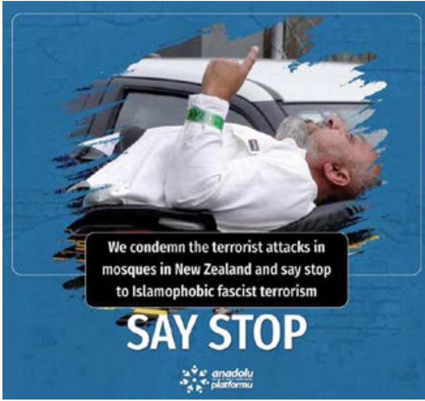
Anadolu Platformu, Yeni Zelanda'da bugün camilere yönelik yapılan terör saldırıları ve 49 Müslümanın katledilmesiyle ilgili bir basın açıklaması yaptı.