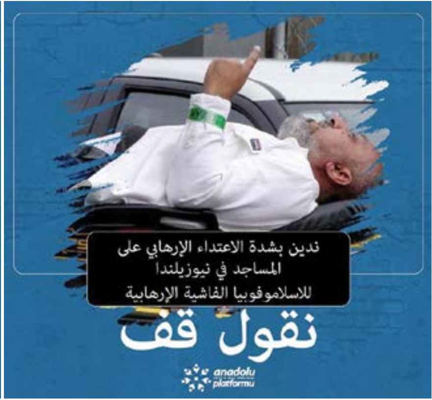
أصدر منبر الأناضول بيانًا صحفيًا بخصوص الهجمات الإرهابية على المساجد في نيوزيلندا والمذبحة التي قتل فيها 49 مسلمًا.